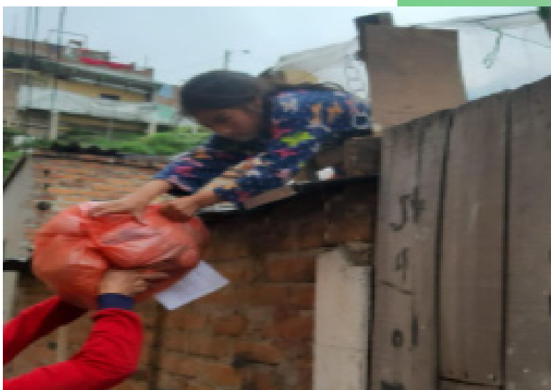
Ipiales recolección de agricultores y entrega a familias que viven del reciclaje.

La sede de Guadalupe Huila también realizó entrega de alimentos para madres cabeza de familia mediante recursos recolectados a través de donaciones en dinero y en especie que generosamente entregaron de miembros de la comunidad