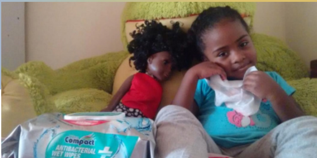
Entrega de toallas antibacteriales en sedes de Bogotá

Al inicio de la pandemia se realizó la entrega de 6000 paquetes de toallas antibacteriales en las 11 sedes de Bogotá, recursos que fueron donados por CAMA y que se hicieron llegar a las familias de las diferentes comunidades donde las sedes tienen presencia.