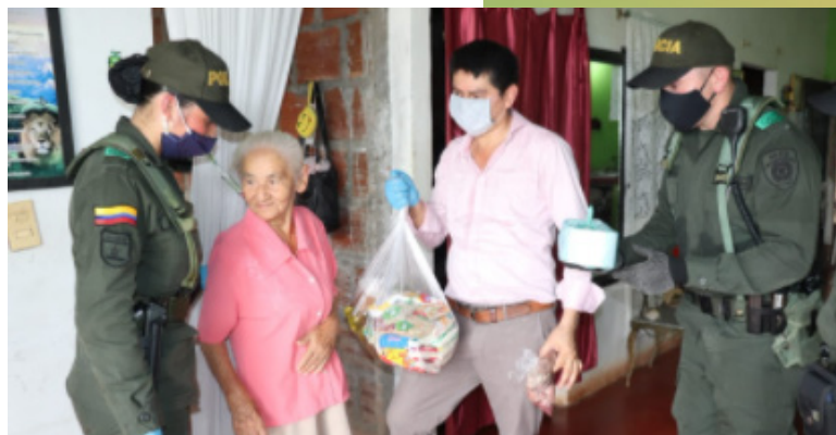
San Vicente del Caguán

Sedes como el Carmelo en el Cauca han convocado a otras sedes y personas de la comunidad para realizar una "Donatón" para llevar víveres a las familias afectadas por falta de alimentos en las zonas urbanas como Popayán, Cali y Santander de Quilichao