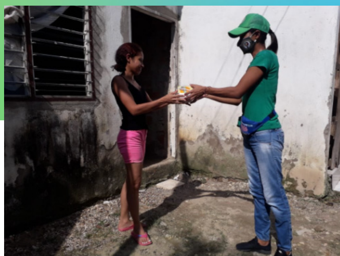
Entrega de Alimentos preparados con donaciones realizadas por LAM Canadá en Cartagena