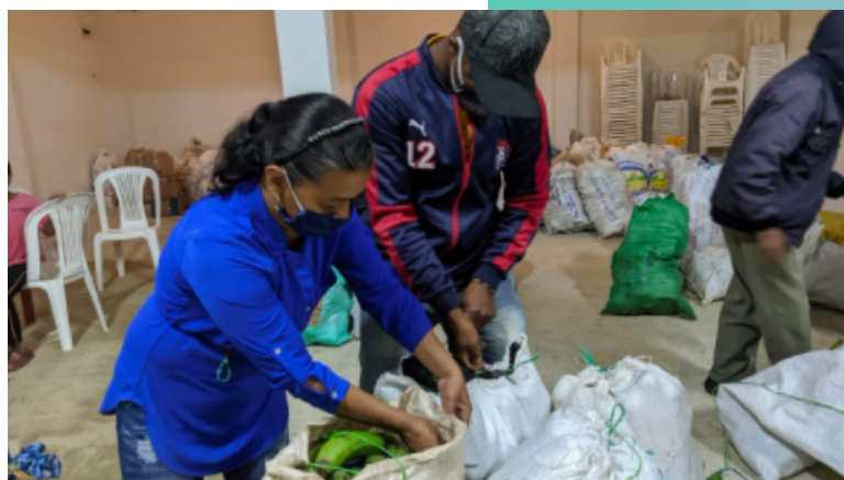
"Donatón" convocada por la sede El Carmelo en Cajibío, Cauca