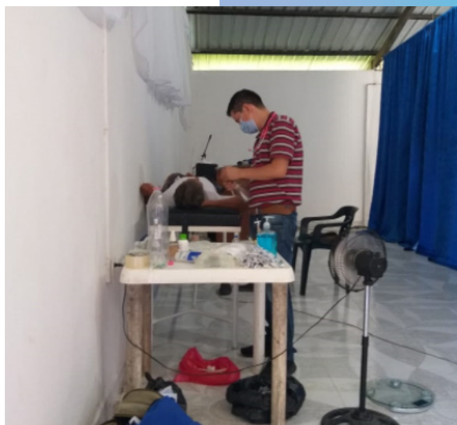
Brigada de Puerto Ospina

En la Sede de Neiva Centro se realizó seguimiento a personas de la comunidad que se vieron contagiadas por el COVID-19 y proporcionó apoyo económico para la compra de medicamentos