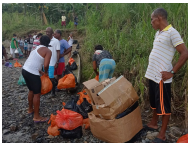
Entrega de Ayudas de sede San Bosco en Lloró Chocó, Afectados por ola Invernal