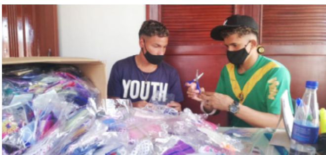
Elaboración de tapabocas en sede Dios es Nuestra Fortaleza, Medellín

Las sedes de Dios es Nuestra fortaleza en Medellín, Santa Cecilia y Buenavista en Bogotá, han elaborado tapabocas y kits de bioseguridad para entregar no solo en las comunas y localidades donde se encuentran sino también a otros sectores de su ciudad fuertemente golpeados por la pandemia y donde existe escasez de recursos en las familias, así como en departamentos como el Amazonas y Santanderes.